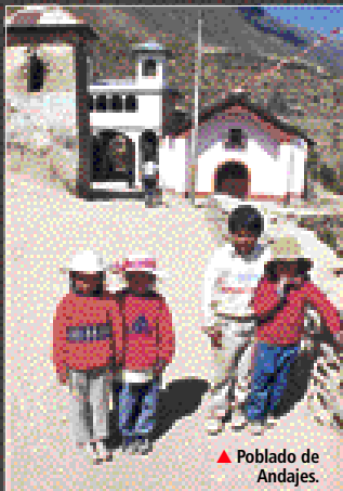
▲ Poblado de Andajes.

Después de partir de Churín y atravesar el río Huaura, se asciende durante una hora por diversos pisos ecológicos; las faldas de los cerros lucen vestidas de frutales, maíz y papa, hasta llegar, finalmente, al tranquilo poblado de Andajes. Su nombre proviene de los topóni-