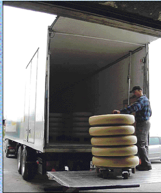
▲ Voluminosos quesos, subsidiados por la comunidad helvética para competir internacionalmente.