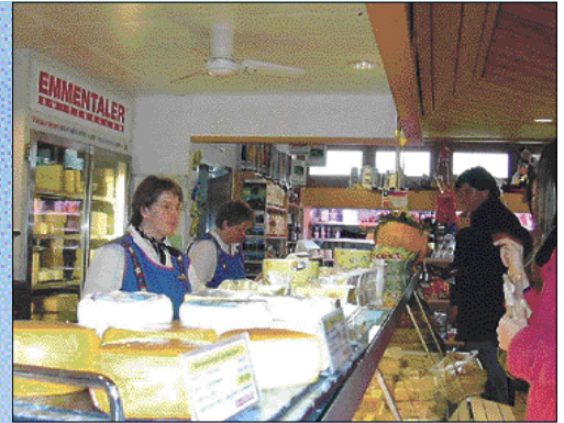
▲ Para todos los gustos: quesos jóvenes y viejos, picantes o salados, elaborados con la tradicional exquisitez suiza.